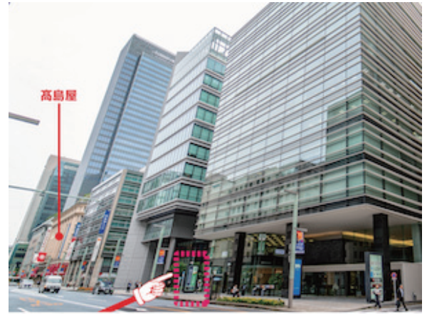
① 「りそな銀行」 [Business Airport] の看板が目印です